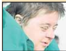
A La Colomnière, on dépasse le handicap